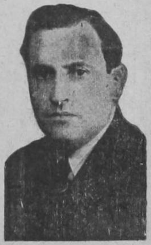
El ilustre ex-Presidente de la Republica, Dr. Calderón Guardia, quien mañana será despedido por una manifestación obrera sin precedentes, hará esta noche, por medio de la Voz de la Victoria, sensacionales declaraciones

Respecto a los sucesos de Guatemala, esta mañana la Secretaría de Relaciones Exteriores se sirvió darnos un comunicado de la Legación de ese país en Costa Rica, en el cual se afirma que ya reina la Paz en Guatemala y que